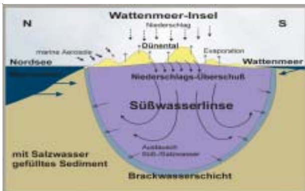
Schema der typischen Süßwasserlinse einer Wattenmeer-Insel