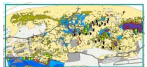
Das neu entwickelte Feuchtklassen-System mit Gefährdungsgraden der Vegetation